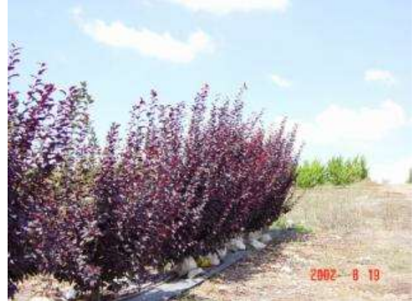
תמונה 1: שזיף Pisardii במחצית אוגוסט 2003