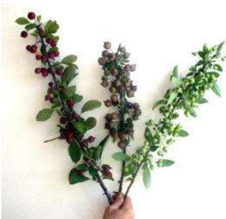
תמונה 7: שלושה זני תפוחי נוי