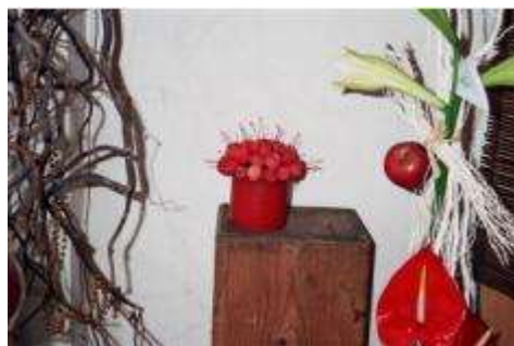
תמונה 6: סידור עם תפוחי נוי