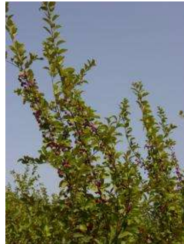
תמונה 3: וורד Sensational Fantasy נובמבר 2004