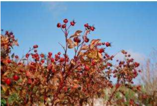
תמונה 4: תפוח Jay Darling אוגוסט 2003