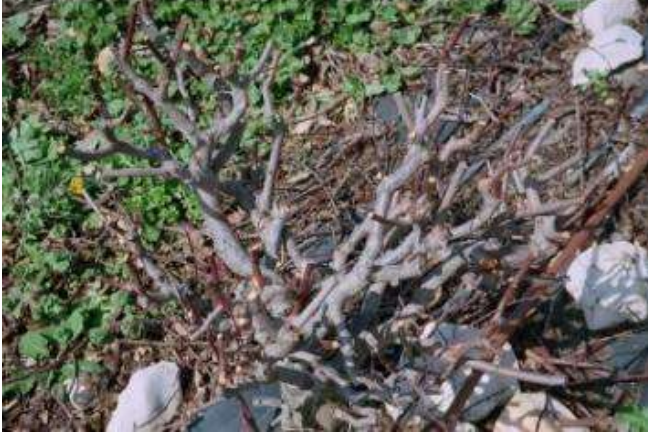
תמונה 2: שזיף Pisardii בשנה 5 לאחר גיזום