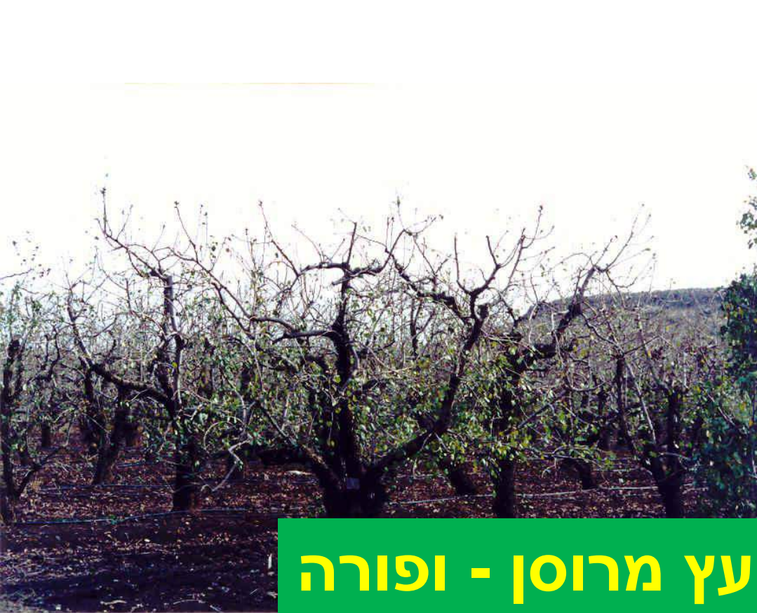
עץ מרוסן - ופורה