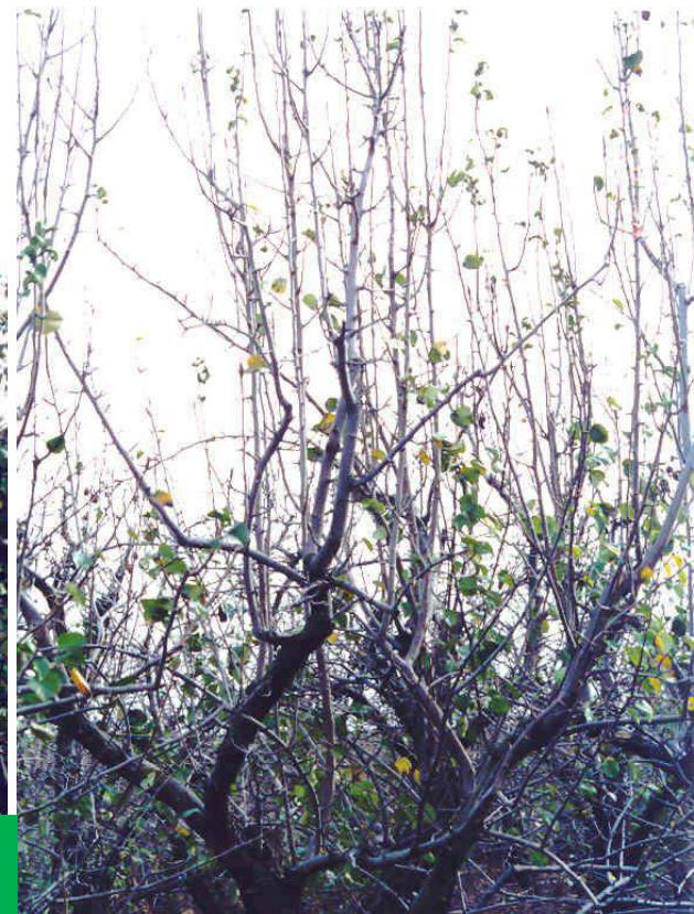
עץ שיצא משליטה ומפוריות